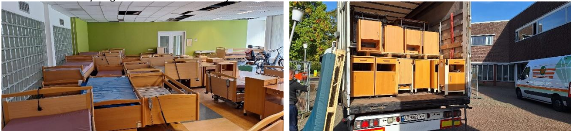
Foto's laden 38 verpleegbedden en 20 nachtkastjes d.d. 16 oktober 2024

Naast het op locatie laden van verpleegbedden is er in 2024 eenmaal bij een basisschool het schoolmeubilair geladen in een Oekraïense trailer, die vervolgens rechtstreeks naar Oekraïne is gereden. In juni 2024 is er een grote partij operatiejasjes gedoneerd en kosteloos bezorgd in de opslagruimte in Bergschenhoek, die vervolgens via een samenwerkende organisatie in de Oekraïense stad Lviv over heel Oekraïne zijn verdeeld.