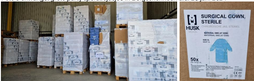
Foto's ontvangst grote partij operatiejasjes in Bergschenhoek d.d. 28 juni 2024

Naast het op locatie laden van verpleegbedden is er in 2024 eenmaal bij een basisschool het schoolmeubilair geladen in een Oekraïense trailer, die vervolgens rechtstreeks naar Oekraïne is gereden. In juni 2024 is er een grote partij operatiejasjes gedoneerd en kosteloos bezorgd in de opslagruimte in Bergschenhoek, die vervolgens via een samenwerkende organisatie in de Oekraïense stad Lviv over heel Oekraïne zijn verdeeld.