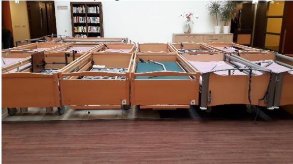
Foto's laden 40 verpleegbedden d.d. 10 maart 2023

Veelal worden de hulpgoederen eerst verzameld in de opslag van de stichting (die kosteloos wordt aangeboden) om vervolgens met een Oekraïense trailer naar Oekraïne te versturen, maar bij grote partijen is het streven om terplekke op de locatie de trailer te laden, bijvoorbeeld de verpleegbedden die in maart 2023 bij een zorginstelling in het oosten van het land zijn geladen. De bedden zijn vanuit de zorginstelling rechtstreeks naar Oekraïne verstuurd.