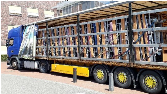
Foto's laden 40 verpleegbedden d.d. 28 juni 2022

Door de oorlogssituatie heeft de stichting in 2022 veel meer hulpgoederen en baten ontvangen dan in voorgaande jaren. Er zijn grote partijen ziekenhuis-/verpleegbedden, onderzoeksstoelen/-tafels, persoonlijke medische beschermingsmiddelen, desinfectiematerialen en persoonlijke verzorgingsproducten gedoneerd. Veelal worden de hulpgoederen eerst verzameld in de opslag van de stichting (die kosteloos wordt aangeboden) om vervolgens met een Oekraïense trailer naar Oekraïne te versturen, maar bij grote partijen is het streven om terplekke op de locatie de trailer te laden, bijvoorbeeld de 40 verpleegbedden die in juni 2022 bij een zorginstelling in het oosten van het land zijn geladen. De bedden zijn vanuit de instelling rechtstreeks naar Oekraïne op transport gegaan.